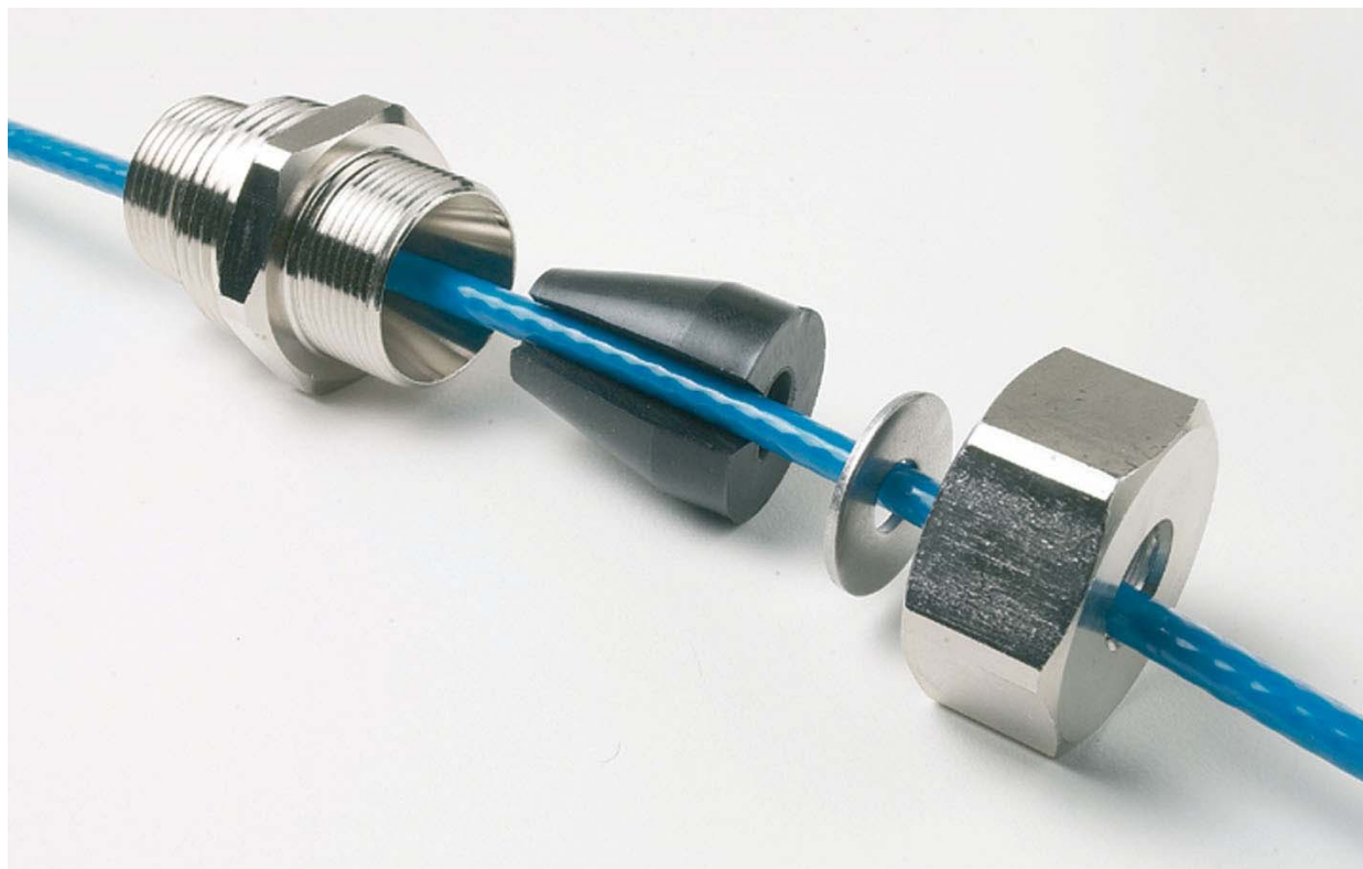
Рис.2. Устройство муфты зажимной для ввода кабеля DPH-10 в трубопровод: корпус, уплотнительная манжета, шайба, накидная гайка (слева направо).

Муфта зажимная состоит из 4-х частей (рис.2):