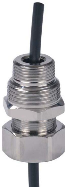
Рис.1. Муфта зажимная в сборе.

Муфта изготавливается в одном варианте исполнения, однако имеет на подсоединительной втулке двухступенчатую резьбу, благодаря чему может применяться в трубопроводах диаметром \frac{3}{4} " и 1" (рис.1).